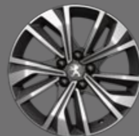
17" MERION bi-ton diamantate