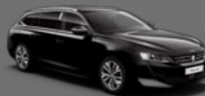
Noir Perla Nera