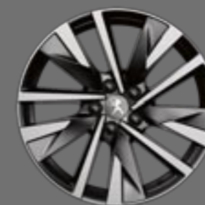
18" SPERONE bi-ton diamantate