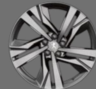
19" AUGUSTA bi-ton diamantate