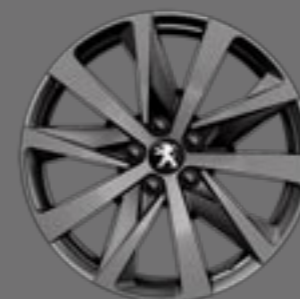
18" HIRONE bi-ton diamantate în nuanță Grey Dust