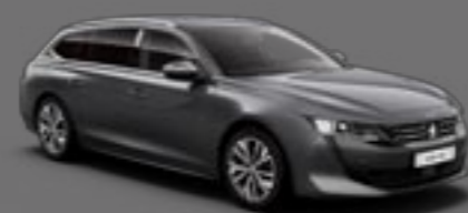
Gris Hurricone (1)