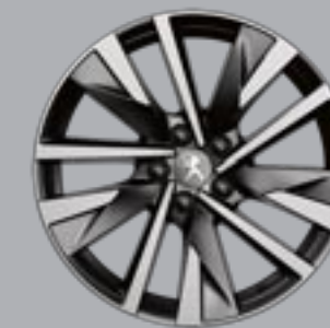
18" SPERONE bi-ton diamantate