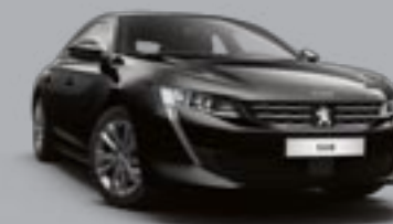
Noir Perla Nero