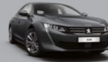
Gris Hurrricane (1)