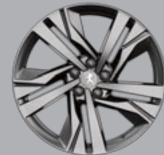
19" AUGUSTA bi-ton diamantate