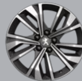
17" MERION bi-ton diamantate