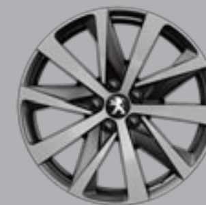
18" HIRONE bi-ton diamantate în nuanță Grey Dust